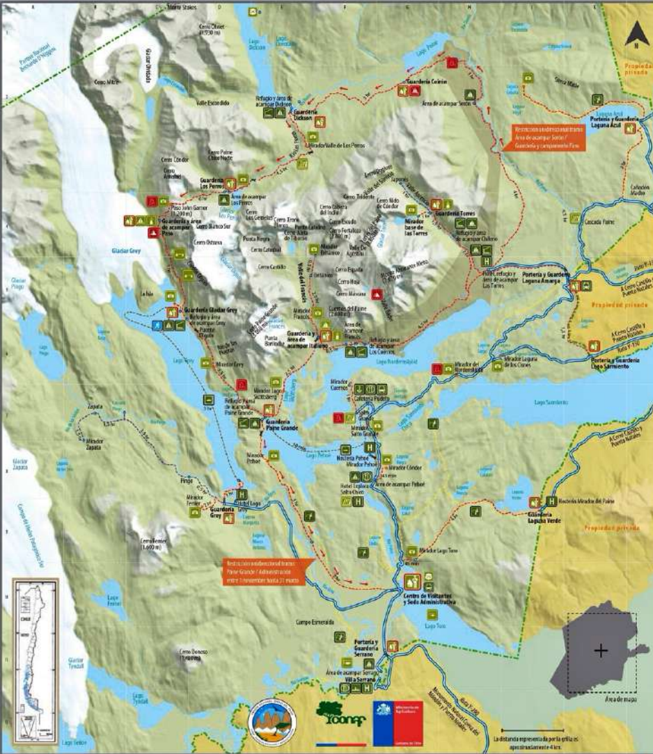
Mapa actualizado como herramienta de orientación turística, sin propósitos cartográficos. En ningún caso libera de las responsabilidades inherentes.